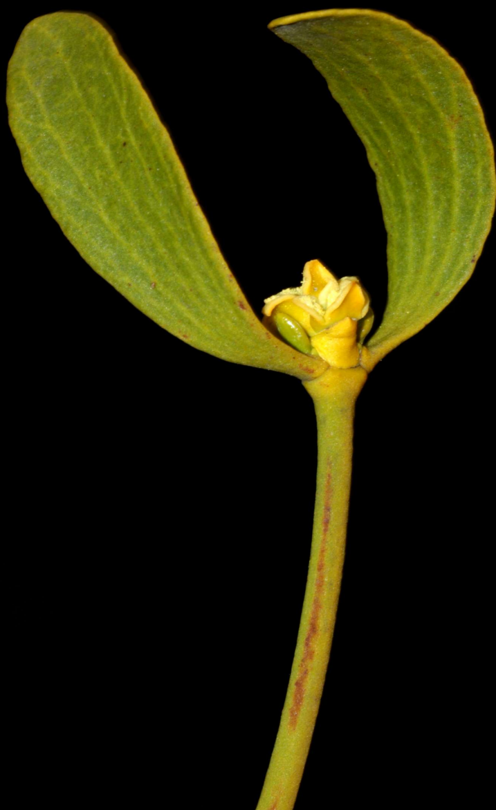
Viscum album . Roncesvalles 2010